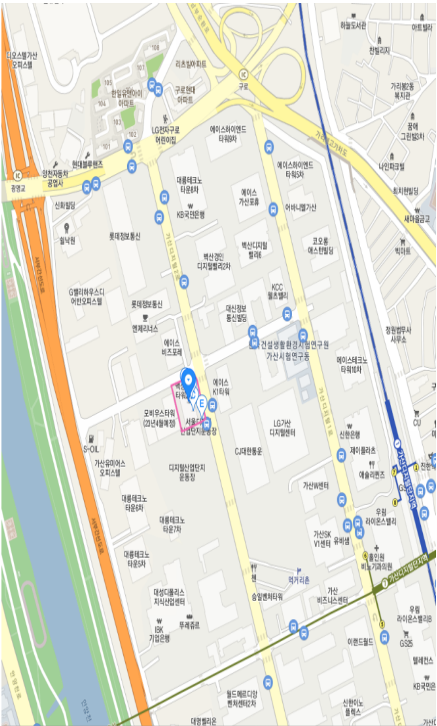
가산산업단지 중심 사거리에 위치