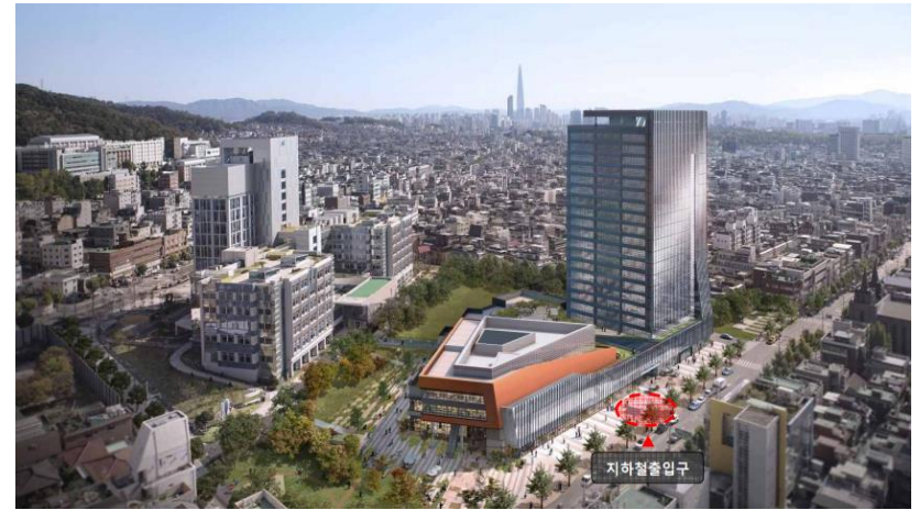
1단계 및 2단계