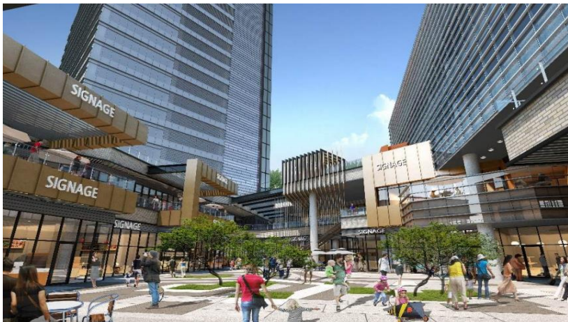
내부. 근생시설 1F