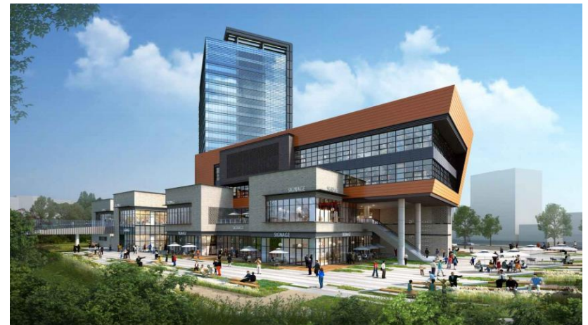
외부. 근생시설 뒷편