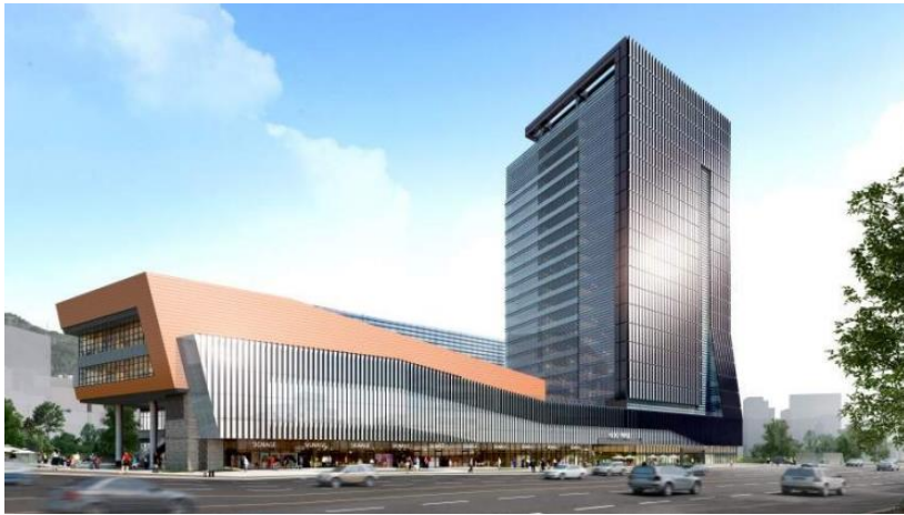
근생시설 및 오피스