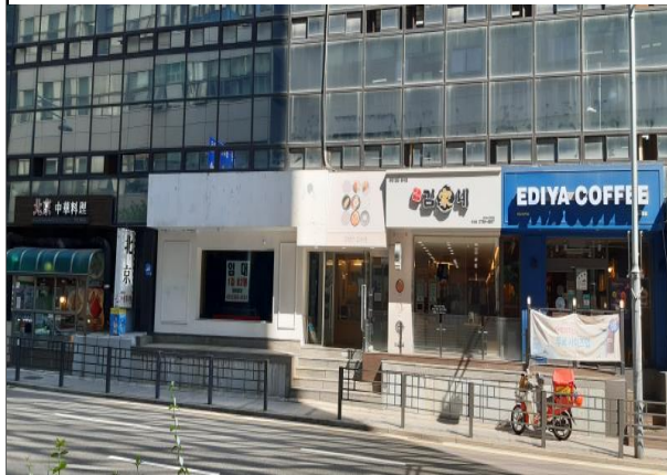
상가 외부 전경