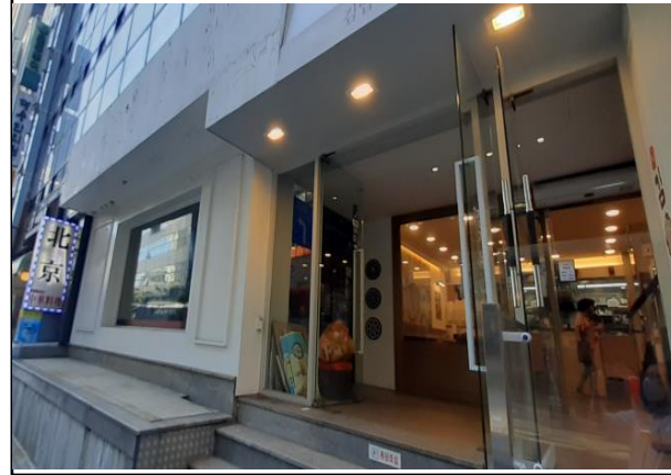
상가 입구 1