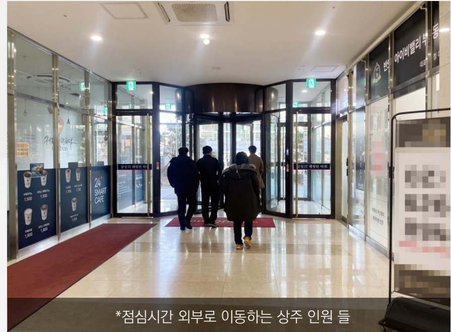
*점심시간 외부로 이동하는 상주 인원 들