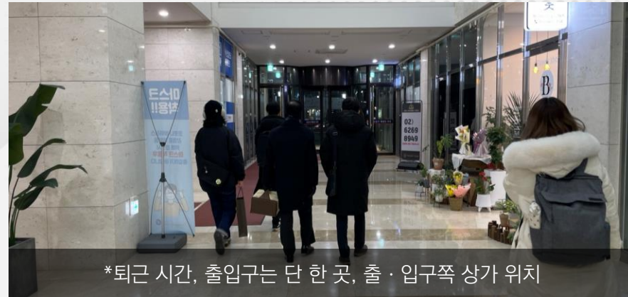
*퇴근 시간, 출입구는 단 한 곳, 출·입구쪽 상가 위치