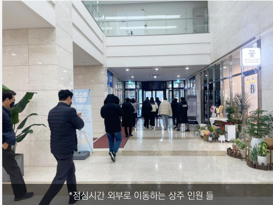
*점심시간 외부로 이동하는 상주 인원 들