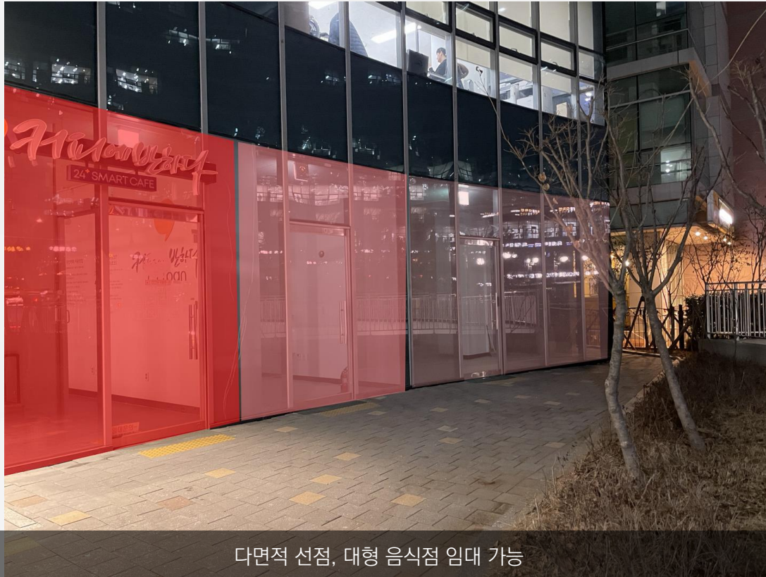
다면적 선점, 대형 음식점 임대 가능