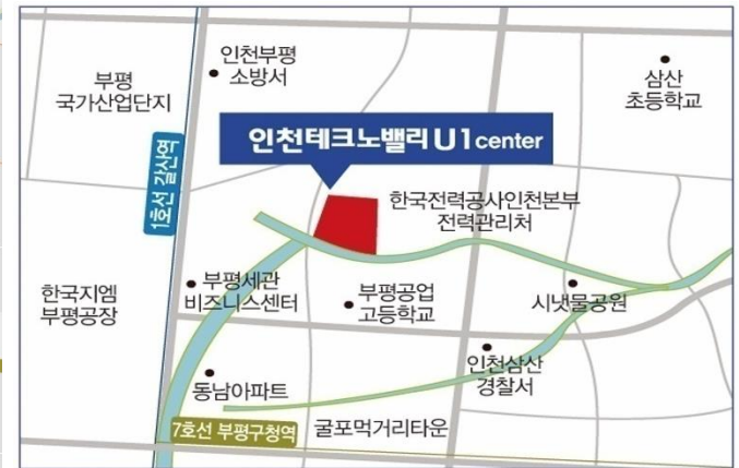
현장위치_ 인천 부평구 갈산동 94번지