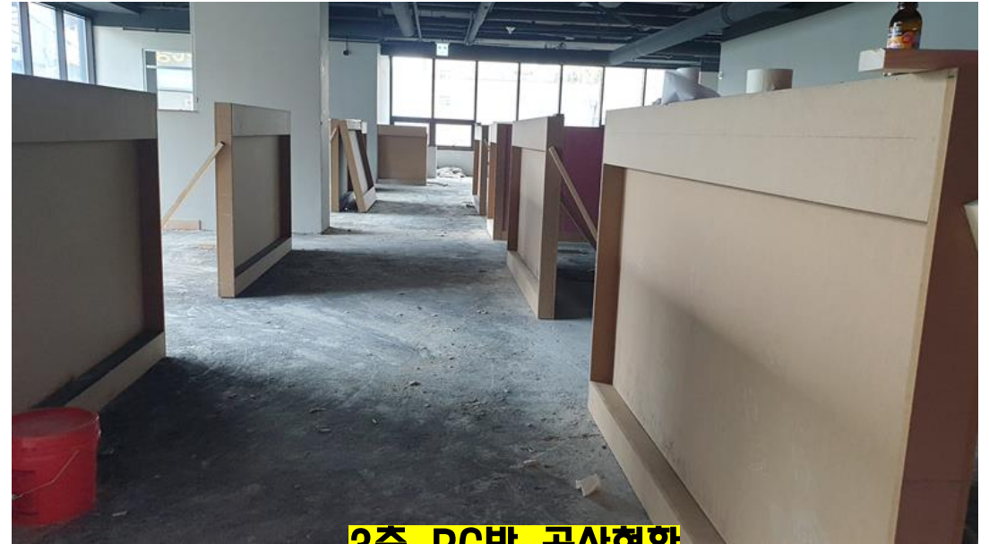
3층 PC방 공사현황