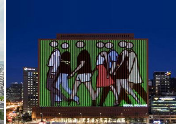
서울스퀘어 전면 LED 미디어 파사드